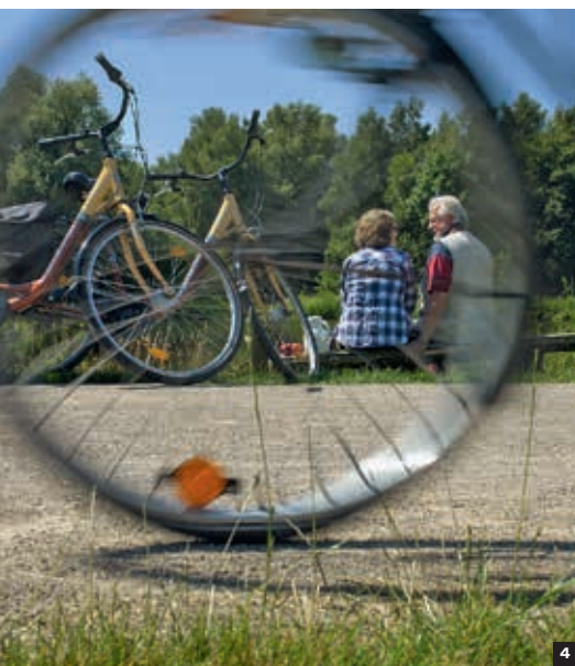
4 Picknick am Wegesrand