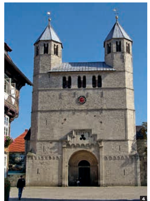
4 Stiftskirche Bad Gandersheim