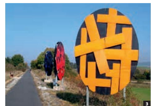
1 Gut Walshausen 2 Bergbaumuseum Salzdetfurth 3 Radweg zur Kunst

Ein kurzes Wegstück und schon ist Bodenburg erreicht. Den historischen Kern bildet Schloss Bodenburg [13] . Von der alten Wasserburganlage ist noch ein Teich als Überbleibsel da, außerdem ein Treppenturm mit schrägen Fenstern. Der angrenzende ehemalige Bullenstall ist denkmal-geschützt und wird heute für Kunstausstellungen und Veranstaltungen genutzt. Das Schloss ist umgeben von einem 2006 renovierten Land-schaftspark.